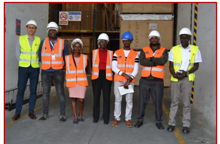
JHIA and AGS pose for a group photographs during a tour at AGS premises